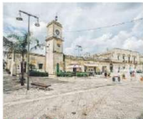
MARTANO Oggi l'incontro

Articolo Gazzetta del Mezzogiorno del 09-10-2019